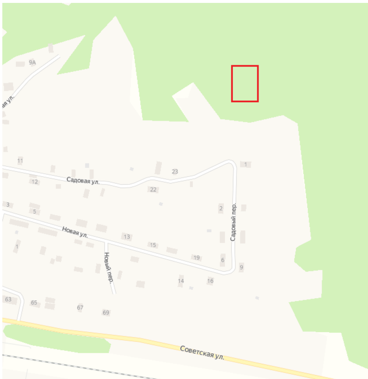
Схема проведения ярмарки