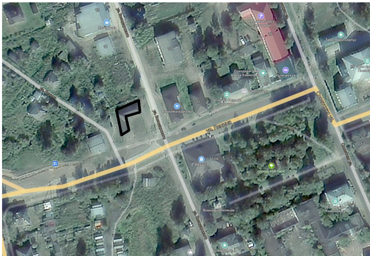
Схема проведения ярмарки