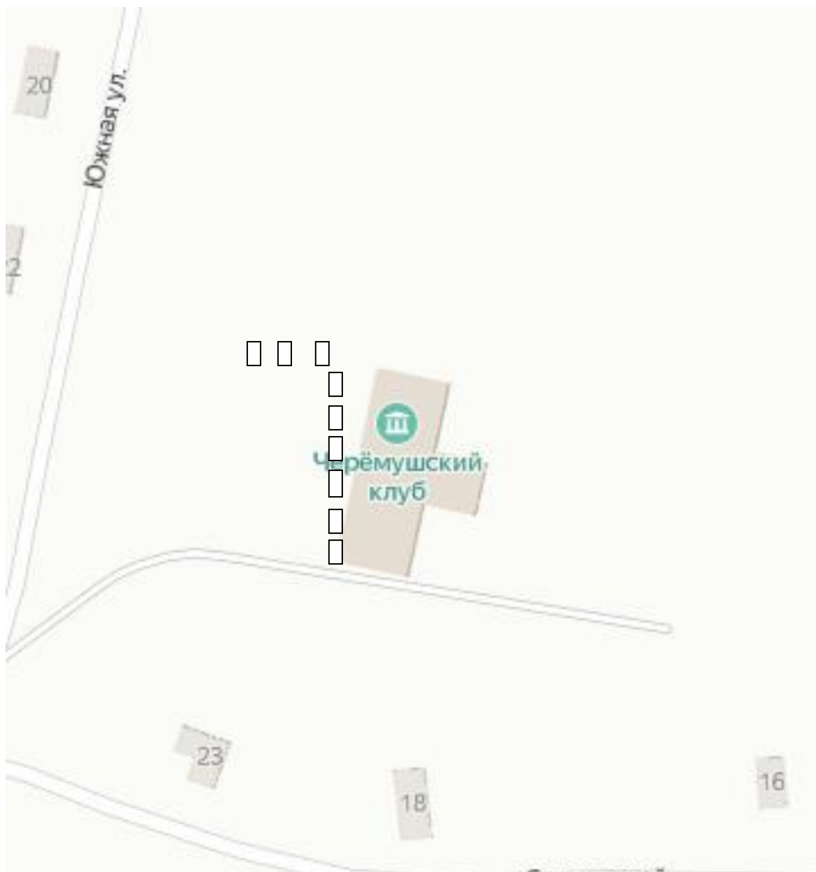
Схема проведения ярмарки