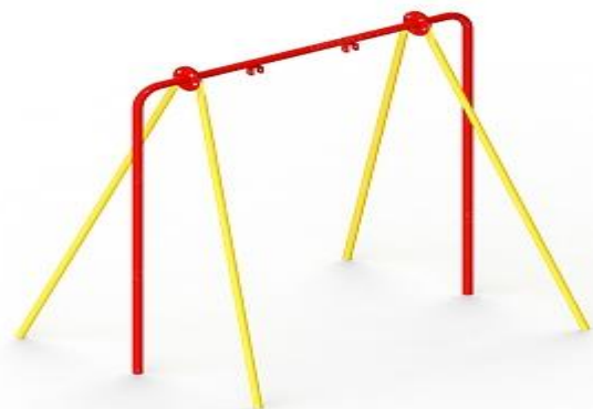
Сушилка для белья