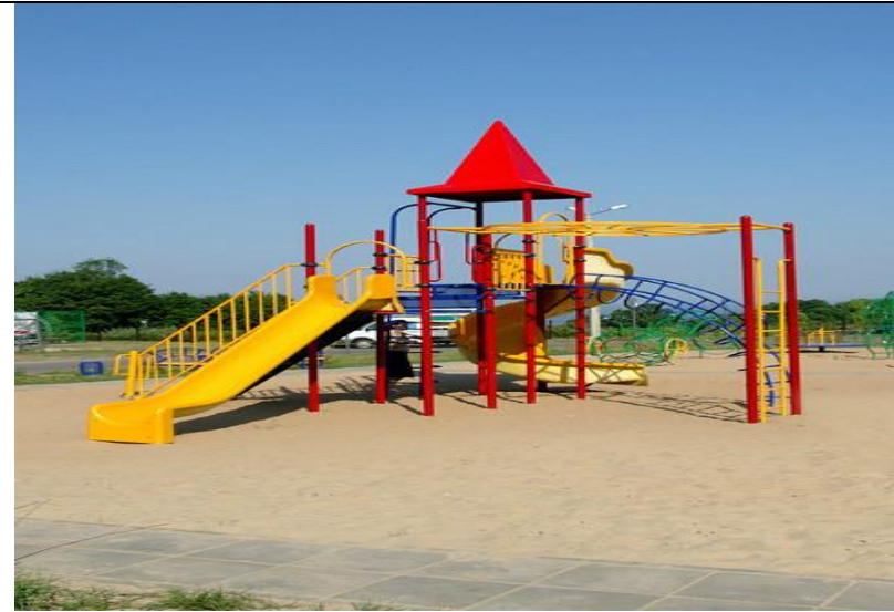
Оборудование детских площадок и игровых комплексов.